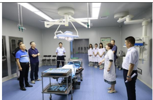
系统自评检查第三检查组在安康分校听取工作汇报、查看实践教学场所及设施