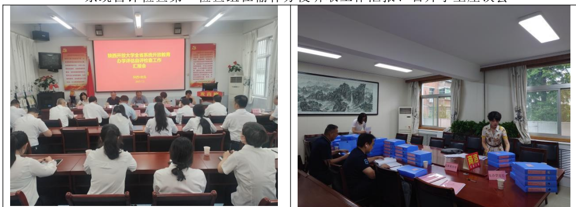
系统自评检查第二检查组在商洛分校听取工作汇报、查看自评材料