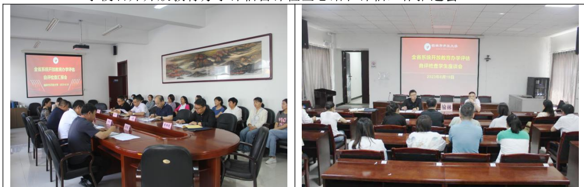
系统自评检查第一检查组在榆林分校听取工作汇报、召开学生座谈会