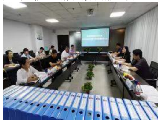
系统自评检查第四检查组在眉县学习中心、电子局学习中心听取工作汇报