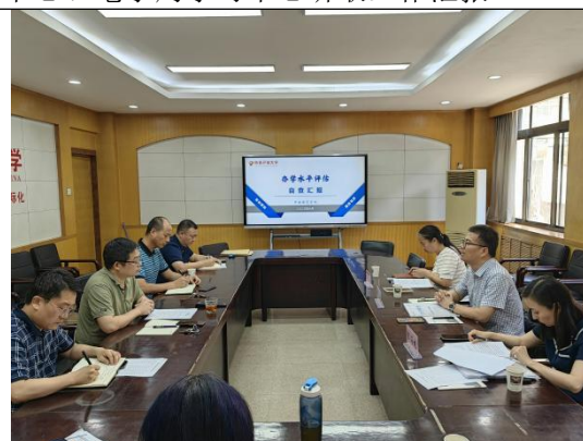
系统自评检查第五检查组在高新分校、开放教育学院听取汇报